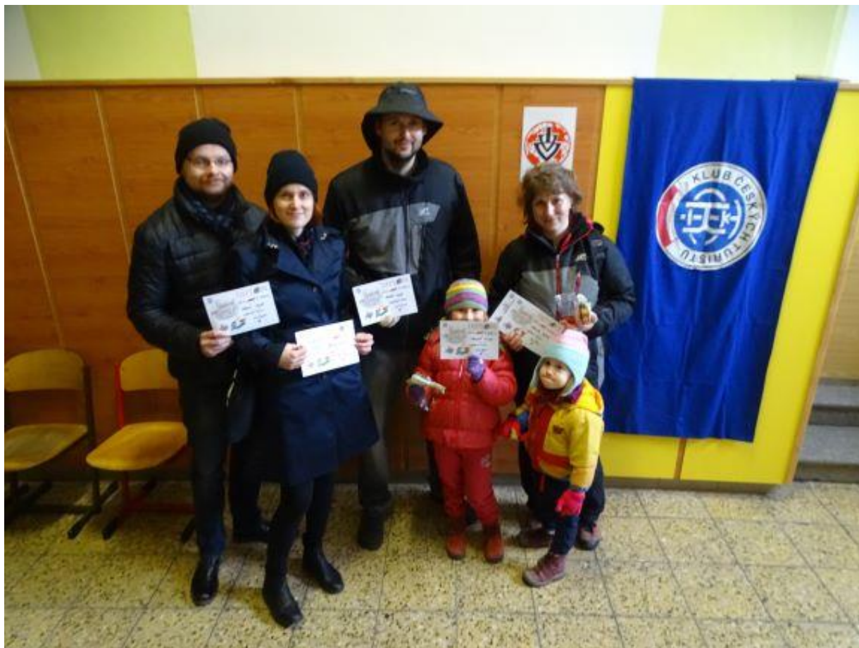
Účastníci akce Běží liška k Táboru