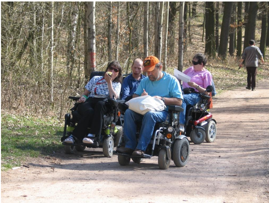
Fotografie z otevření stezky pro vozičkáře