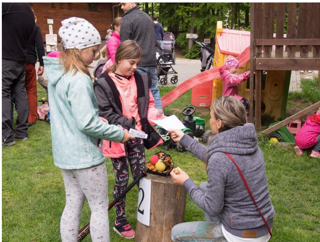
Zdroj KČT: Turistická akce Putování Moravským Slováckem

Zdroj Zpráva o činnosti Jihomoravské oblasti KČT