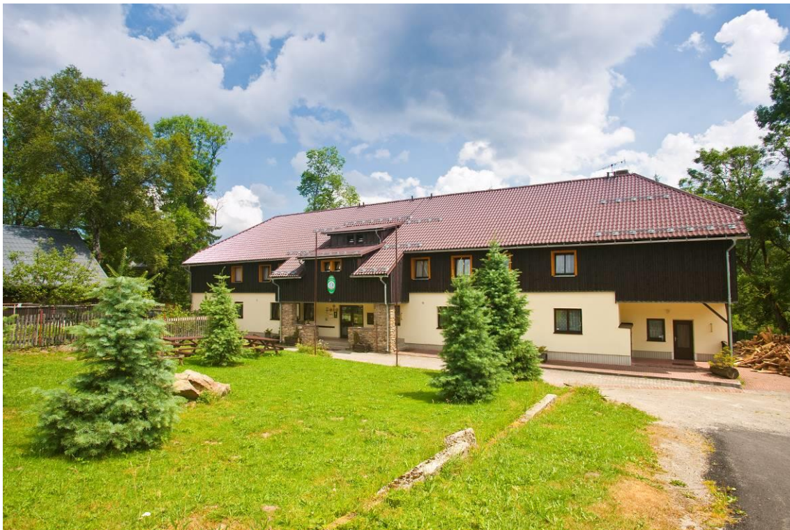
Turistická chata Prášily

Klub českých turistů provozuje síť turistických chat. Klubu českých turistů se daří držet v provozu turistické chaty, které nabízejí příjemné a dostupné ubytování pro turisty i další zájemce o turistiku a cykloturistiku